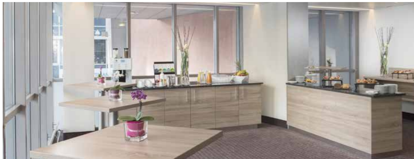
Breakout Area Obergeschoss