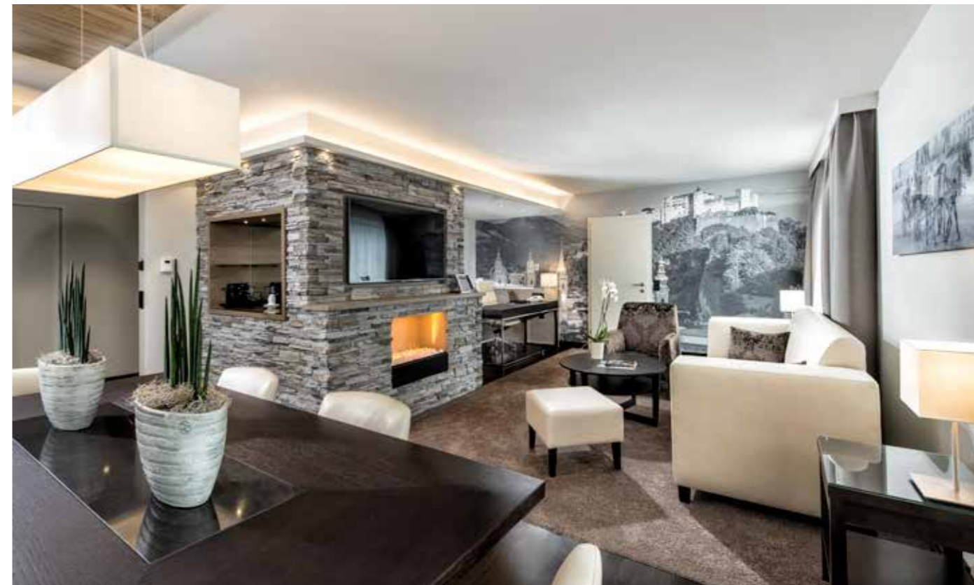
Executive Grand Suite

einer Willkommensüberraschung und der Zutritt zu unserer Clublounge ist inklusive. In der Clublounge laden wir Sie ein, das kleine, aber feine Frühstücksbuffet, Snacks und Getränke zu probieren und dabei die Aussicht auf unserer Sonnenterrasse zu genießen.