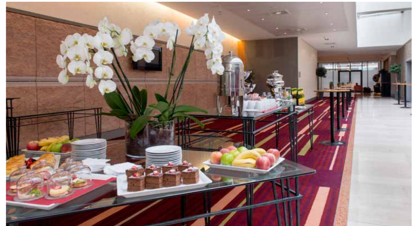
Break Out Area Erdgeschoss