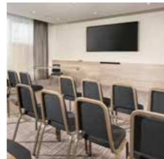
50 m 2 Tagungsräume