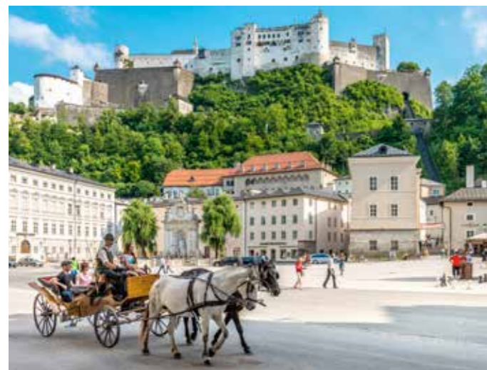
Kapitelplatz - Blick auf die Festung Hohensalzburg

Das Forum 1 finden Sie direkt um die Ecke von unserem Hotel. Mit seinen 42 Shops und Gastronomiebetrieben ist es optimal für einen kurzen Besuch.