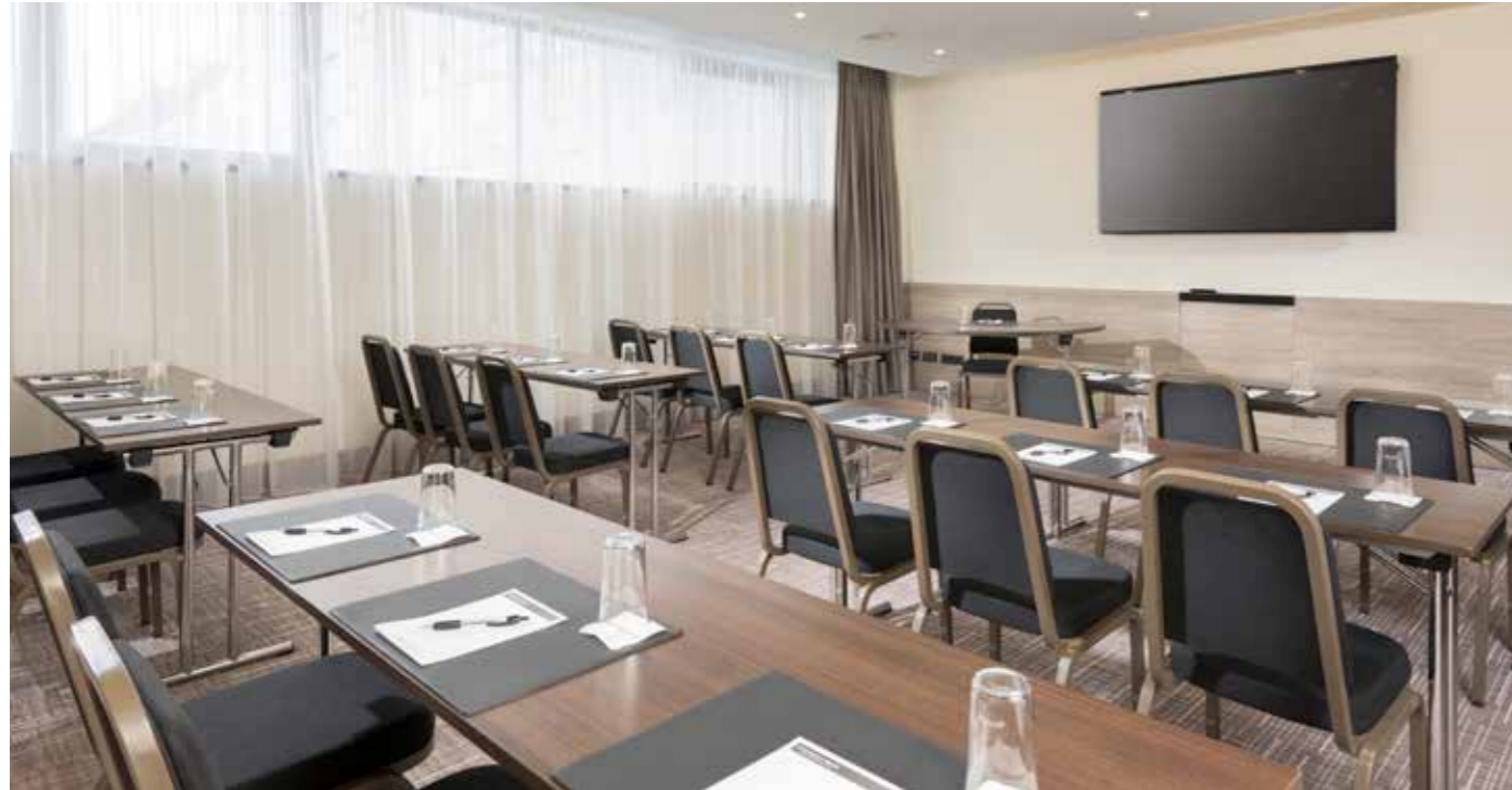
50 m 2 Tagungsraum

Die modernen Räumlichkeiten sind voll klimatisiert, verfügen über Tageslicht und sind mit einer innovativen High-End Konferenztechnik wie 82 Zoll LCD Bildschirme ausgestattet. Da sich der 960 m 2 große Ballsaal im Herzen des Hotels befindet verfügt er über ein hochmodernes Tageslichtkonzept, welches Freiraum zu kreativen Farbspielen lässt. Wie wäre es zum Beispiel in den Farben Ihres Firmenlogos?