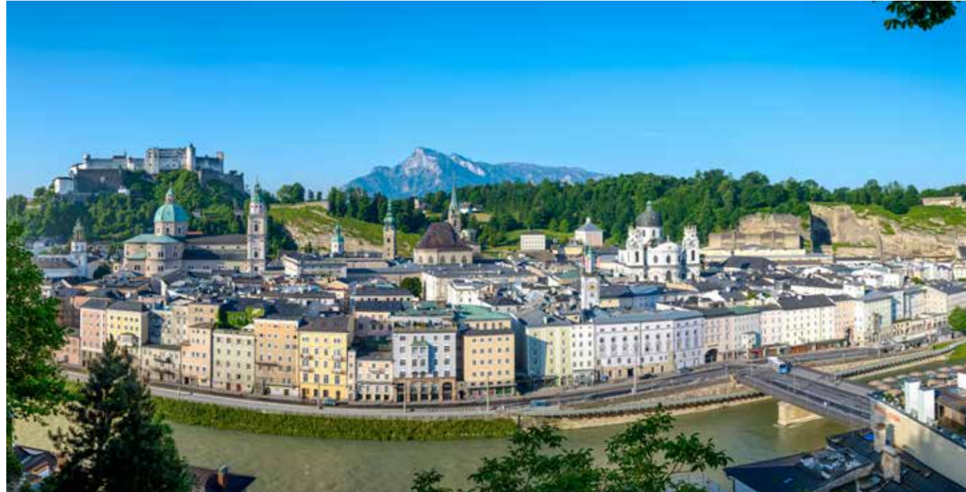
Blick auf die Salzburger Altstadt

Salzburg – eine Stadt die seinesgleichen sucht. Bilder sagen mehr als 1000 Worte und nicht umsonst wurde Salzburg als UNESCO Weltkulturerbe deklariert: