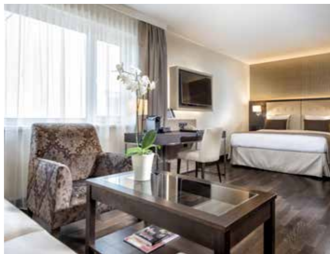
Executive Business Class Zimmer

Das Angebot für Geschäftsreisende: Die Executive Business Class Kategorie bietet Ihnen Hotelzimmer mit einer Größe von 28 m 2 . Alle Business Class Zimmer verfügen über ein Queensize Bett, eine komfortable Sitzecke und einen kleinen Arbeitsplatz. Die Zimmer sind zusätzlich ausgestattet mit einer Nespresso Maschine, einer Tageszeitung,